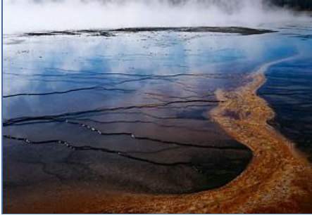
Dòng suối Prismatic trong công viên Yellowstone, công viên quốc gia đầu tiên của nước Mỹ, Wyoming. (Hình: Lương Quang Tuấn)