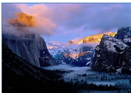
Công viên quốc gia Yosemite, California, nơi khiến Lương Quang Tuấn ở lại Mỹ lâu dài và dành hết thời gian đi săn ảnh.